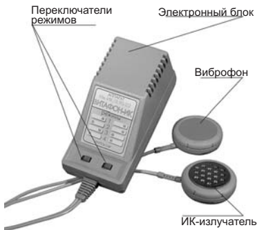
Рис. 2. Внешний вид аппарата

излучателя – металлический диск с равномерно распределенными по поверхности отверстиями, в которые вмонтированы оптические элементы источника ИК-излучения. Рабочие поверхности преобразователей имеют декоративное покрытие. Электронный блок имеет встроенную сетевую вилку. На лицевой панели электронного блока размещены переключатели режимов работы аппарата и этикетка, на которой показаны положения переключателей для каждого из режимов. Переключение режимов можно производить, не отключая аппарат от сети.